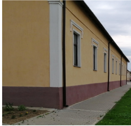
Foto.1. Instituții centrale în localitatea Livezile, lipsite de prezența vegetației, supuse poluării fonice

Comuna Livezile se înscrie în categoria arealelor supuse din ce în ce mai mult, unui ușor continentalism climatic, temperaturile foarte ridicate vara, urmate de vânturi puternice sau ploi cu caracter torențial care provoacă adesea inundații, acestea reprezentând alte câteva probleme ecologice al căror impact este resimțit adesea prin efectele secundare pe care le provoacă.