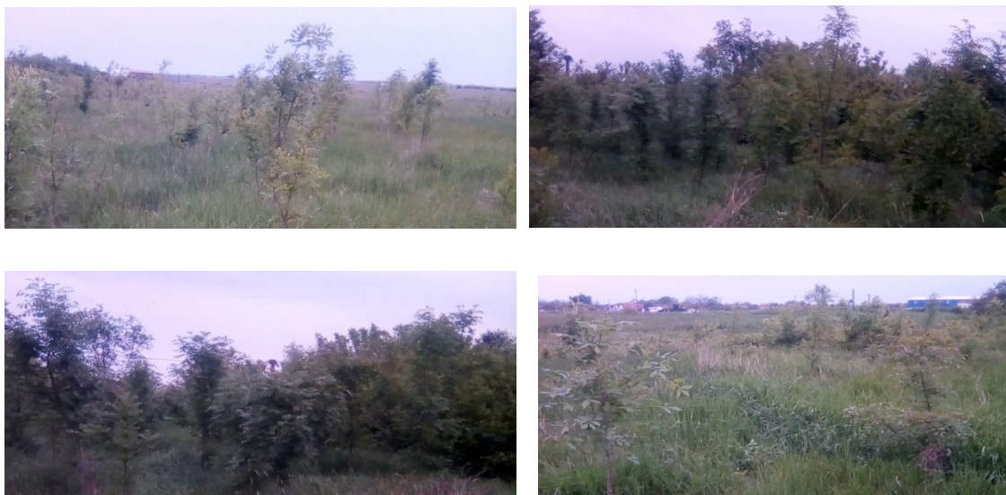
Foto.2. Areal împădurit în zona gării în anii 2012-2013 (localitatea Livezile)

Unul dintre cele mai recente demersuri cu privire la amenajarea spațiului verde în vecinătatea unităților școlare a fost plantarea de brăduți în fața școlii, areal neprotejat de nici un fel de vegetație (foto.3). Demersul plantării brăduților a fost realizat recent, urmând ca în