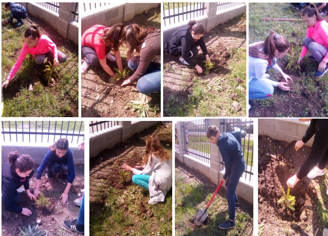
Foto 3. Plantarea brăduților în fața Școlii Gimnaziale Livezile (aprilie 2019)

perioadele viitoare să extindem activitatea și în zona altor instituții în vecinătatea cărora spațiul verde propriu zis lipsește.