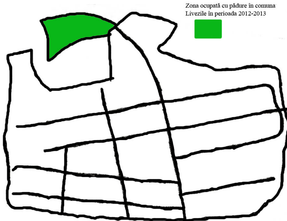
Figura 2. Arealul ocupat cu puieti în localitatea Livezile, în anii 2012-2013